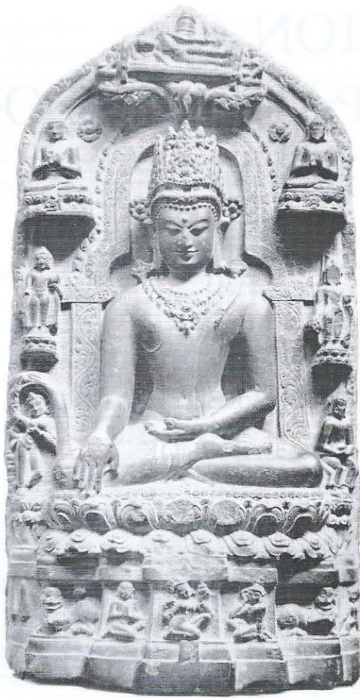
Fig 1. Bengal or Bahār. The Buddha displaying the Eight Great Miracles. X-IX century A.D.