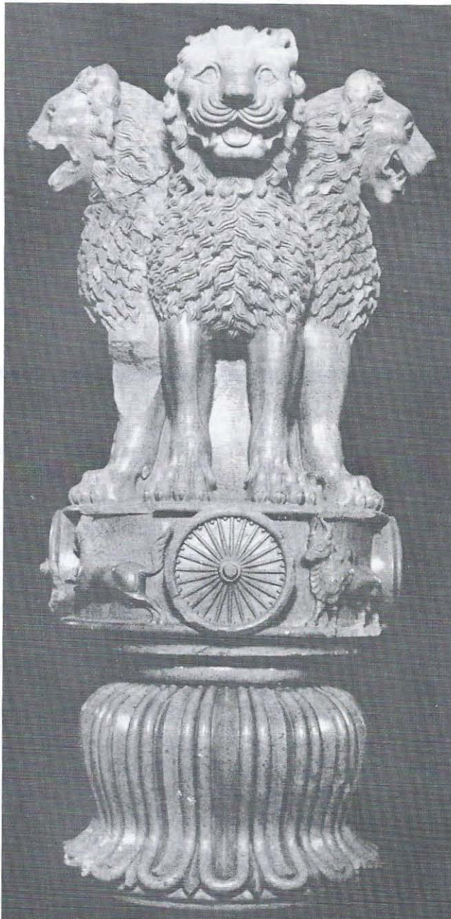
Fig. 4. Sārnāth. Lion Capital. III century B.C.

been recited at the time of the First Buddhist Council, in the year following the Mahāparinibbāna, and then copied in Sanskrit, includes this important point. It is perfectly in agreement with the development of the Life of the Blessed One, in particular the Great Magic Miracles of Savatthi and the Teaching given in the Heaven of the Thirty-Three, that in order to help others to reach salvation, Buddha shows himself to all beings